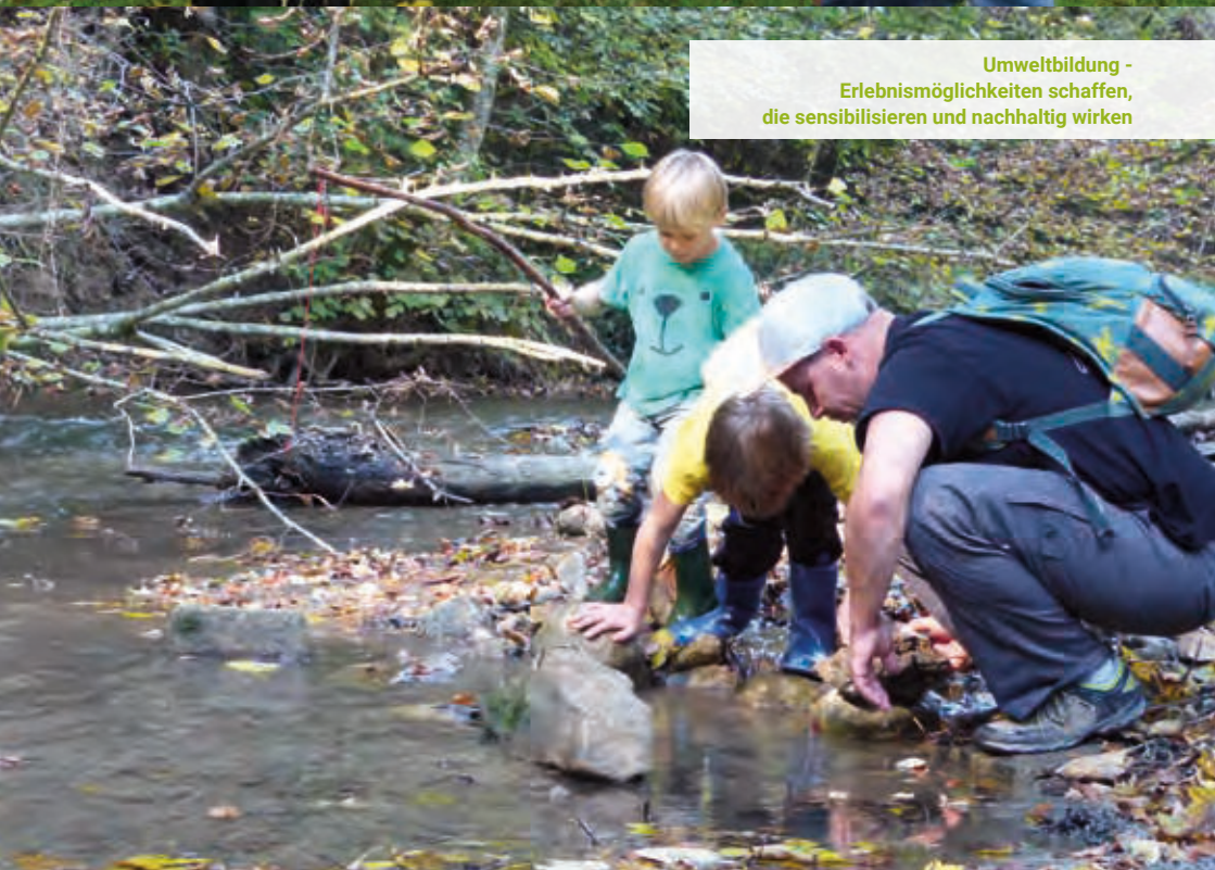
Umweltbildung - Erlebnismöglichkeiten schaffen, die sensibilisieren und nachhaltig wirken