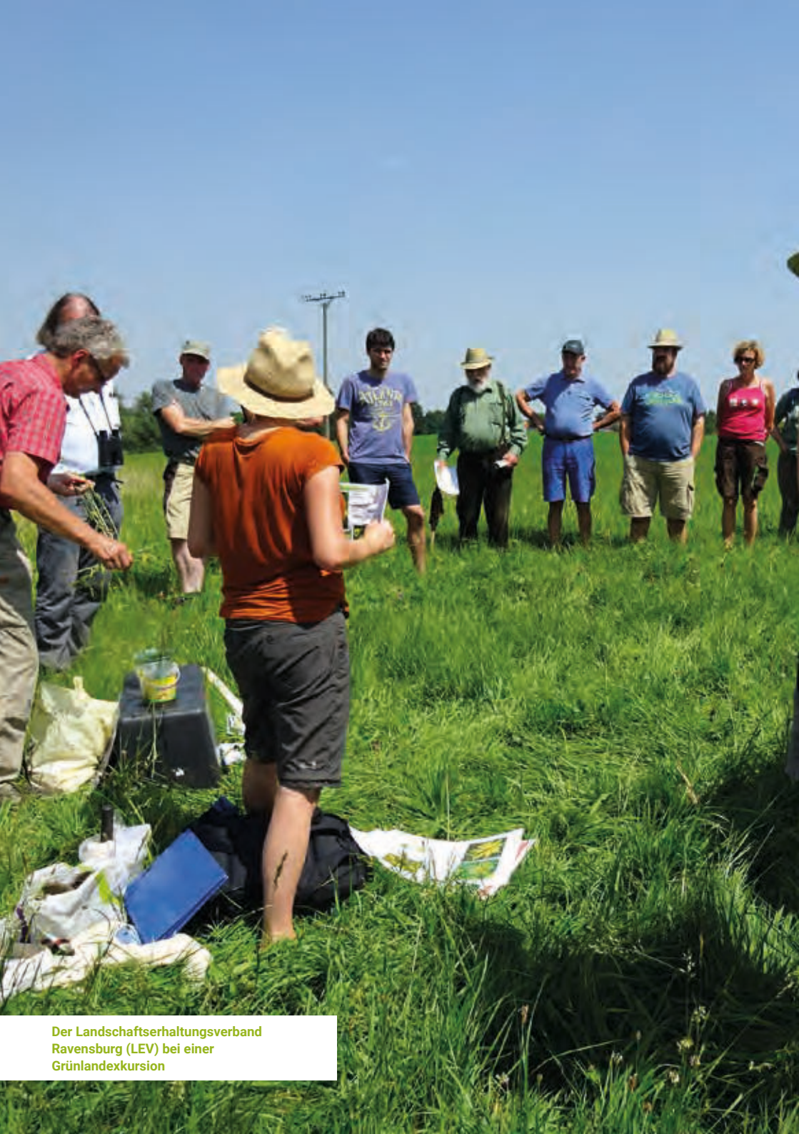
Der Landschaftserhaltungsverband Ravensburg (LEV) bei einer Grünlandexkursion