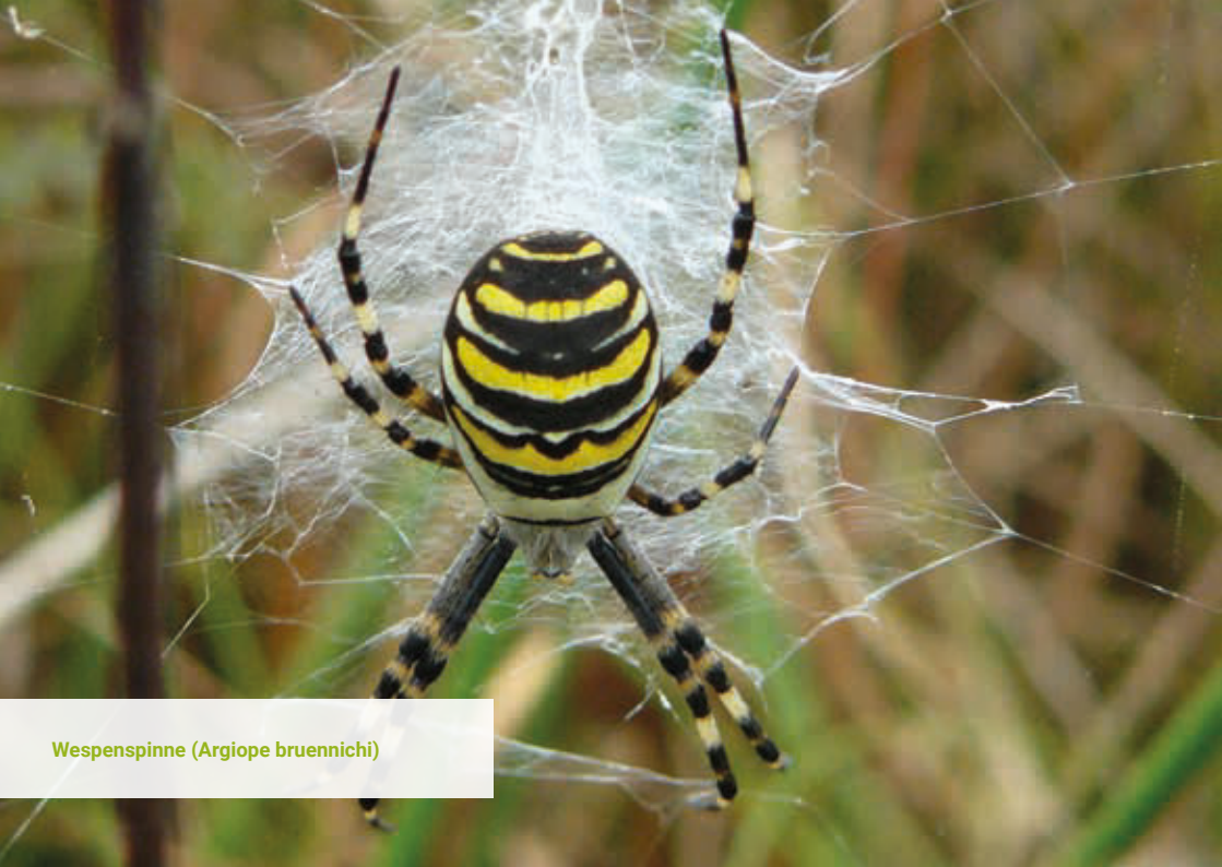
Wespenspinne ( Argiope bruennichi )