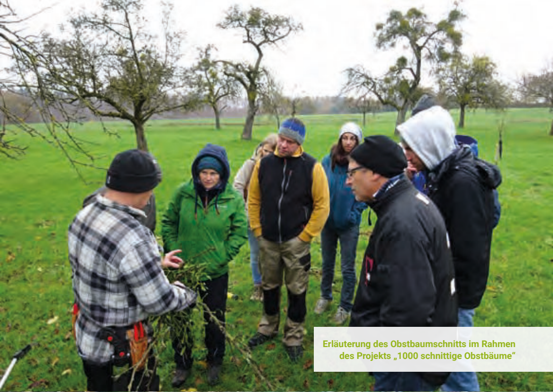
Erläuterung des Obstbaumschnitts im Rahmen des Projekts „1000 schnittige Obstbäume“