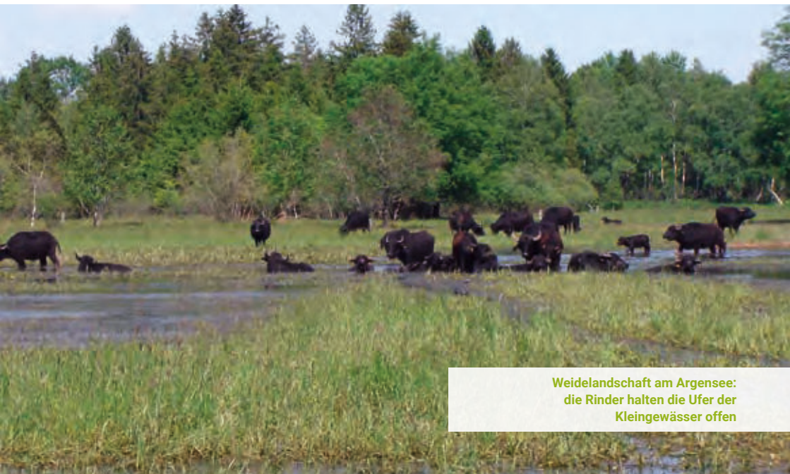
Weidelandschaft am Argensee: die Rinder halten die Ufer der Kleingewässer offen