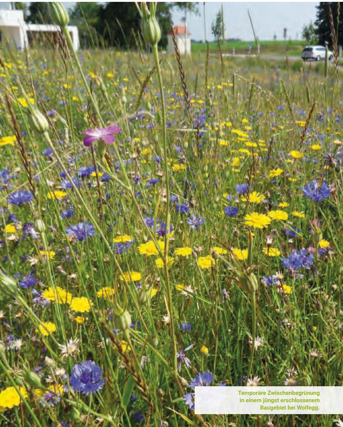
Temporäre Zwischenbegrünung in einem jüngst erschlossenem Baugebiet bei Wolfegg.