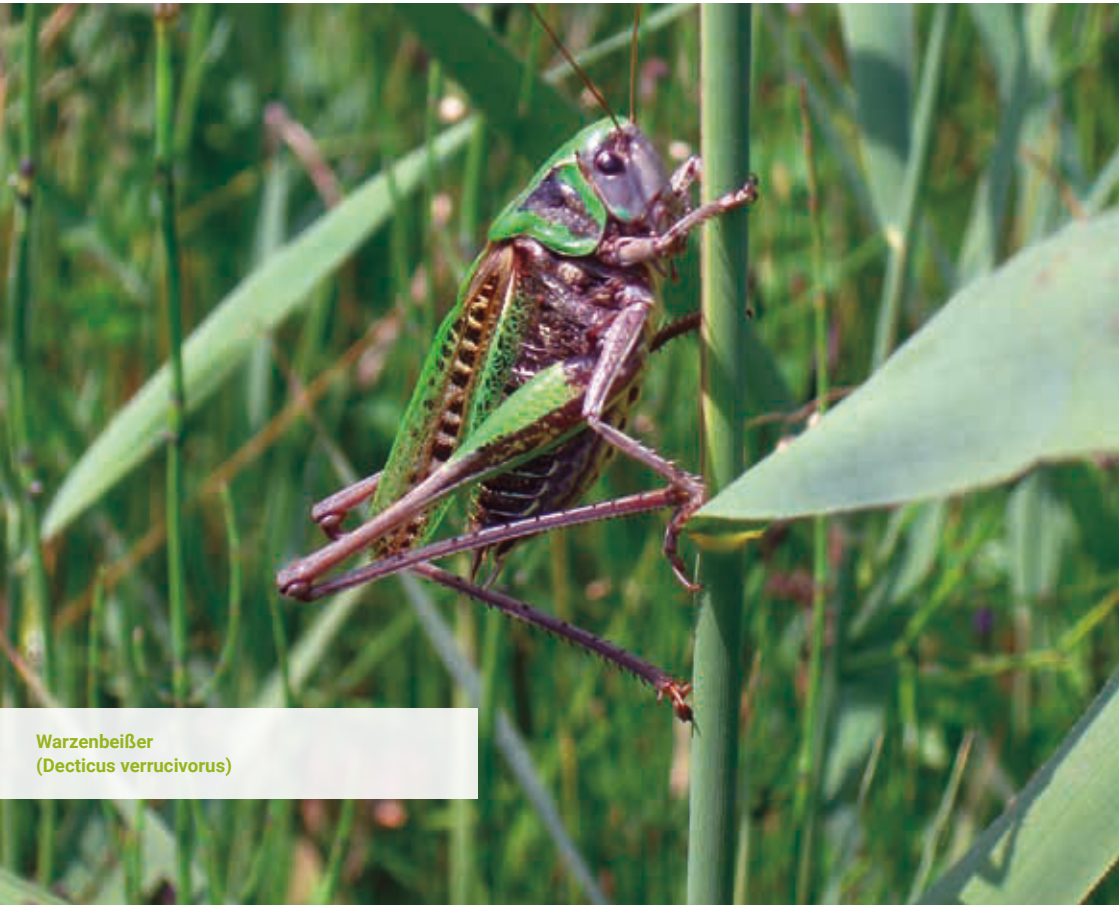
Warzenbeißer ( Decticus verrucivorus )

Die Strategie zur Stärkung der biologischen Vielfalt orientiert sich an den Akteuren und Flächen, die wesentliches Erhaltungs- und Entwicklungspotenzial für die Biodiversität aufweisen. Die Projekte und Aktivitäten konzentrieren sich vor allem auf die Handlungsmöglichkeiten der Landkreisverwaltung, der Städte und Gemeinden, der Landwirte, der Privatgartenbesitzer sowie der Unternehmen.