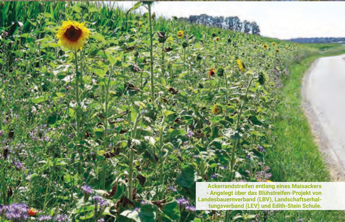
Ackerrandstreifen entlang eines Maisackers - Angelegt über das Blühstreifen-Projekt von Landesbauernverband (LBV), Landschaftserhal- tungsverband (LEV) und Edith-Stein Schule.