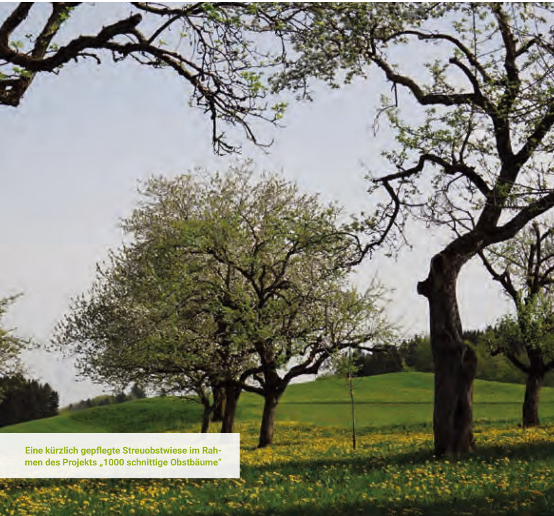
Eine kürzlich gepflegte Streuobstwiese im Rahmen des Projekts „1000 schnittige Obstbäume“

Der Landkreis stellt Mittel und Infrastruktur bereit, damit die Strategie zur Stärkung der biologischen Vielfalt langfristig Bestand hat und alle relevanten Akteure an der Umsetzung und Fortentwicklung teilhaben können.