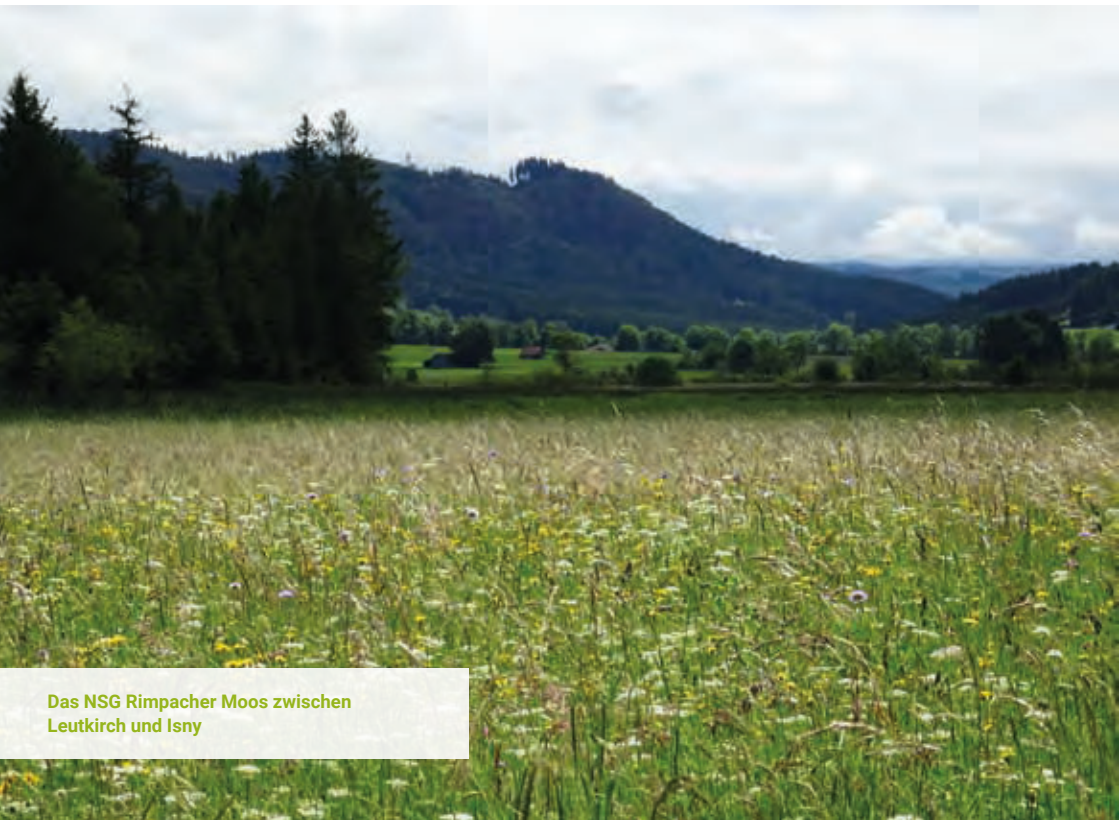
Das NSG Rimpacher Moos zwischen Leutkirch und Isny

Der Landkreis Ravensburg zeichnet sich durch eine besonders vielgestaltige Landschaft und eine große Vielfalt an Lebensräumen aus. Die zahlreichen Schutzgebiete, der gut etablierte Vertragsnaturschutz sowie die Kompetenz und das Engagement der öffentlichen und privaten Naturschutzakteure im Landkreis bilden eine starke Basis für den Erhalt und die künftige Entwicklung der Biodiversität.