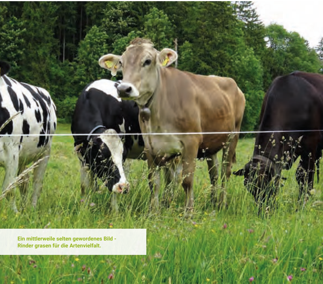
Ein mittlerweile selten gewordenes Bild - Rinder grasen für die Artenvielfalt.

Der Landkreis Ravensburg wird sein Handeln, seine Flächenbewirtschaftung und seine Projekte stärker an den Erfordernissen der Biodiversität ausrichten und so weitere Akteure einbinden und vernetzen. Insgesamt werden das Bewusstsein und die Motivation für die biologische Vielfalt gesteigert.