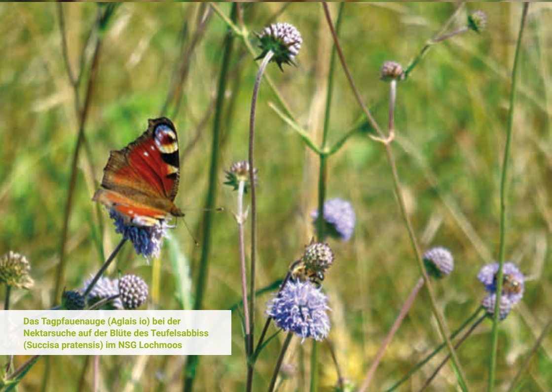
Das Tagpfauenauge ( Aglais io ) bei der Nektarsuche auf der Blüte des Teufelsabbiss ( Succisa pratensis ) im NSG Lochmoos