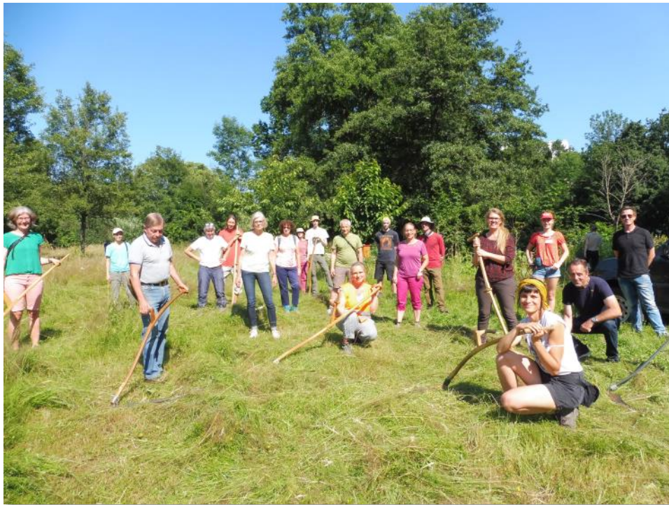
Das Projekt „Freiburg packt an“ unterstützt bürgerschaftliches Engagement auf öffentlichen Grünflächen. So fand zum Stadtjubiläum ein Sensenkurs statt.

der Sense erlernen wollten. Der Workshop bat einen Einstieg in den Umgang mit der Sense als nachhaltiges, umweltfreundliches Mähgerät. Die Freiwilligen, die sich in urbanen Gärten als Obstbaum- oder Wiesenpatinnen und Wiesenpaten auf öffentlichen Flächen für die Biodiversität und Gemeinschaft engagieren, werden von Bürgermeister Martin Haag herzlich begrüßt. Er bedankt sich für die Bereitschaft, die Grünflächen im Rahmen von „Freiburg packt an“ nachhaltig aufzuwerten.