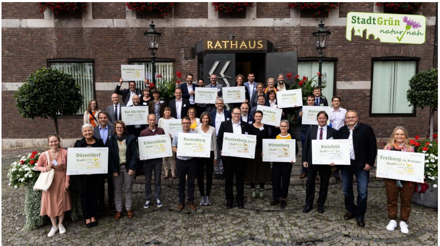
Label-Kommunen der dritten Runde: Gold für Arnberg, Düsseldorf, Eckernförde, Freiburg, Göttingen, Kronberg und Ravensburg. Silber für Bad Dürkheim, Bielefeld, Geretsried und Germersheim. Bronze für Blankenburg, Stutensee, Wertheim und die Lutherstadt Wittenberg.