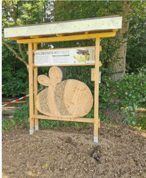
Wildbienennisthilfe im Naturpark Pfaffenhofen.

Der Schlangen-Knöterich ( Bistorta officinalis ), auch als Wiesen-Knöterich bezeichnet, wird als regionale Besonderheit hierbei in den Fokus gerückt, um