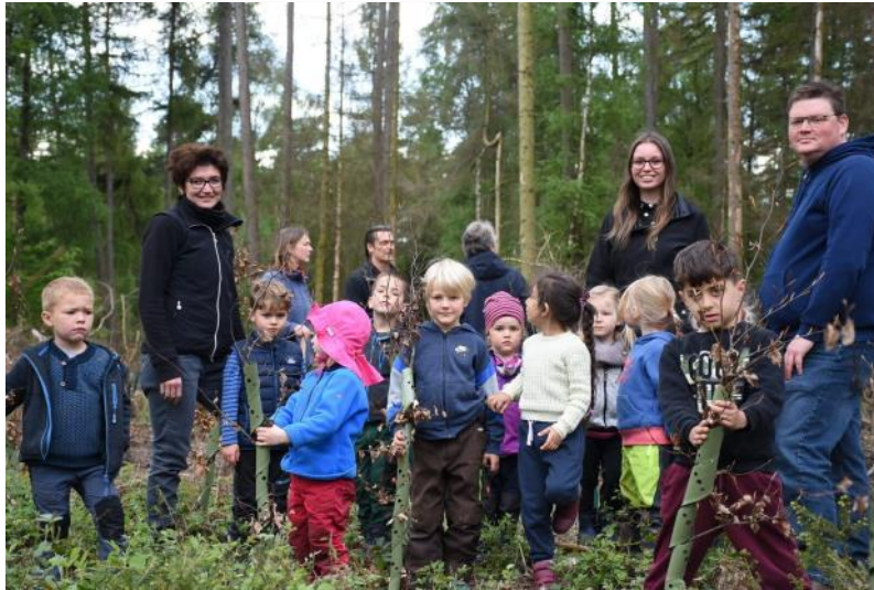
Im Mai schloss die Stadt Porta Westfalica mit Hilfe einiger Kinder die Aufforstung im Wald hinter dem Porta-Bad im Bereich Holzhausen ab. 750 Buchen sollen dort abgestorbene Fichten ersetzen.

Der 25. Naturschutztag Schleswig-Holstein stellt das zentrale Anliegen der Biodiversitätsstrategie des Landes Schleswig-Holstein in den Mittelpunkt. Die Tagung benennt die wichtigsten Themenfelder und bisherigen Lösungsansätze. Neben Besonderheiten Schles-