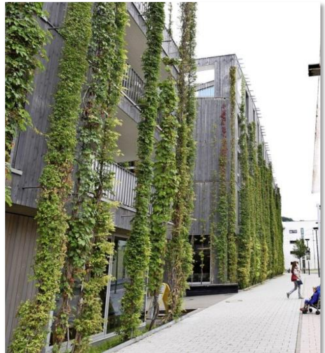
Das Green-City-Hotel im Quartier Vauban in Freiburg.

Mehr Informationen rund um das Bündnis finden Sie unter www.kommbio.de