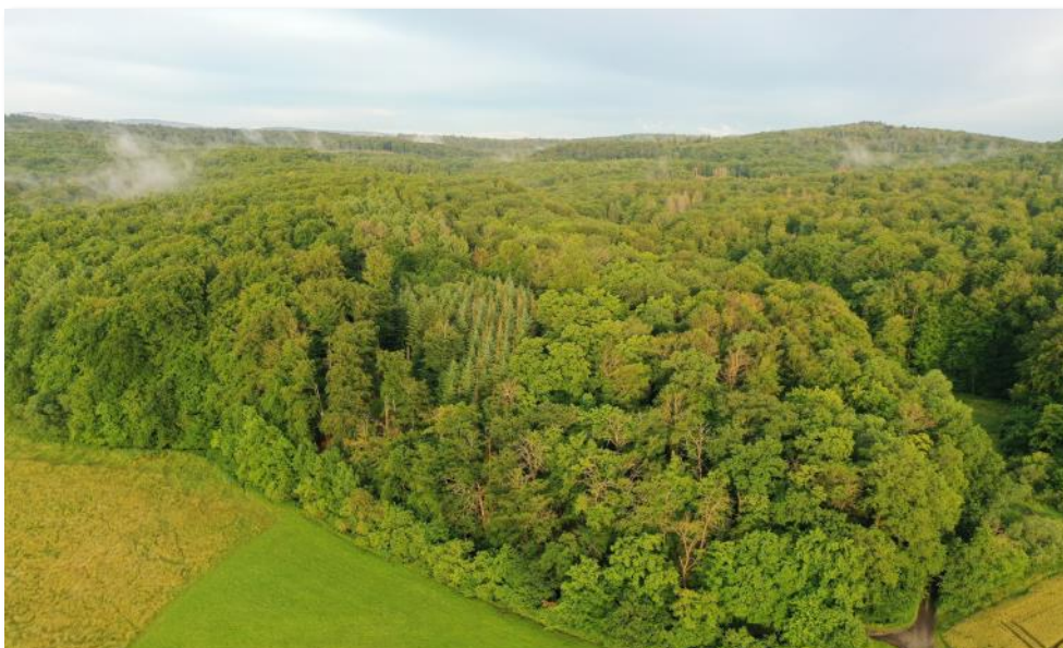
Laubacher Wald - Neue Hessische Waldwildnis entsteht durch Sicherung von 224,5 Hektar über Mittel des Wildnisfonds.

Mehr Informationen rund um das Bündnis finden Sie unter www.kommbio.de