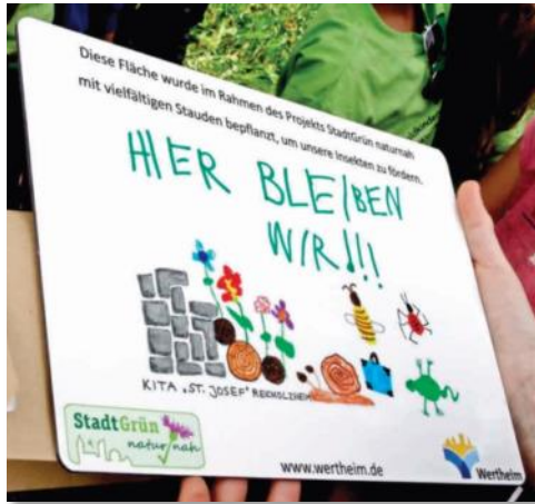
Eines der beiden Sieger-Motive.

Groß war die Freude bei den jungen Gewinnerinnen und Gewinnern des Schilderwettbewerbs und ihren Erzieherinnen. So kamen die Zwerge aus dem Reicholzheimer St. Josef- und Wertheimer Waldkindergarten zu Ruhm und Ehre, als ihre Schilder vorgestellt wurden. Beim Wettbewerb im Rahmen des Projektes „StadtGrün naturnah“ waren Kindergärten und Schulen, aber auch Bürgerinnen und Bürger eingeladen, Hinweisschilder für die Aktionsgrünflächen zu gestalten. Mit diesen soll die Bürgerschaft über den naturnahen Pflanz- und Pflegemodus informiert werden. Christoph Häfner, Projektleiter der Abteilung Umweltschutz der Stadtverwaltung Wertheim, erklärt Kindern und Erwachsenen der Preisträger, warum die Schilder wichtig sind: „Wir wollen, dass sie Leute verstehen, warum die Flächen so aussehen und auch mal wilder wirken.“ Zudem sollen die Bürgerinnen und Bürger verstehen, dass es für die Natur wichtig ist, abgeblühte Blumen über den Winter stehen zu lassen.