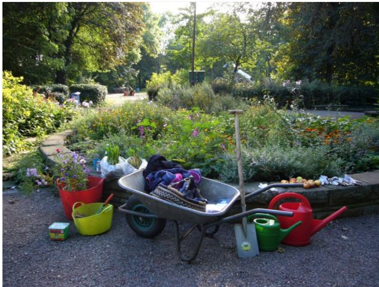
In Kants Garten in Duisburg gibt es immer was zu tun.

Kants Garten ist ein 2.300 qm großer blühender Gemeinschaftsgarten im Kantpark im Stadtzentrum Duisburgs. Dafür hat das Duisburger Amt für Umwelt 2013 eine Fläche verfügbar gemacht und unterstützt die Bürgerinitiative. Kants Garten ist ein sehr abwechslungsreiches Kleinod mitten in der Stadt. Es gibt viele Blumen- und Gemüsehochbeete, Gärten der Kinder, üppige Schattengärten, einen Biotopgarten mit Igelhotel, Totholzbiotop und Teich, einem Wildbienenhaus und eine große Wiese auf der im Frühjahr tausende Krokusse, Blausternchen, Schneestolz und Waldanemonen blühen und auf der eine Gartenbank in der Sonne steht! Hier begegnen sich Menschen jeden Alters und aus unterschiedlich-