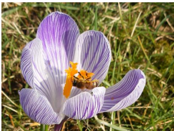
Einen sonnigen Frühling wünscht das Bündnis-Team.