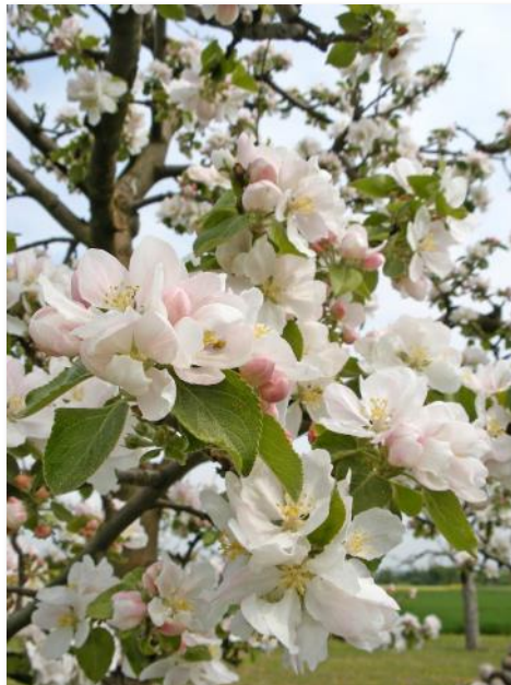
Im Frühjahr begeistern Bäume durch ihre Blütenpracht, im Sommer durch Schatten.

Rund 63,3 Prozent des Dortmunder Stadtgebietes sind grün, weist das städtische Vermessungs- und Katasteramt für Dortmund aus. Eine wissenschaftliche Analyse kommt nun zu dem Schluss, dass Dortmund sogar die viertgrünste Stadt weltweit und die grünste in Deutschland ist. Eine neue Analyse (der sogenannte Husqvarna Urban Green Space Index, kurz HUGSI) kommt zu diesem Schluss. Das Start-up Overstory mit Sitz in den Niederlanden und den USA hat dazu Satellitenbilder von 155 verschiedenen Städten aus 60